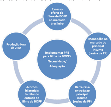
Figura1 - Fatores envolvendo o PPB de filme BOPP

Especificamente no caso, parece problemática a implantação de uma regra de conteúdo local quando o produtor nacional de resina de PP é monopolista e há barreiras (e.g. direitos antidumping) à entrada deste insumo, o que, em tese, poderia facilitar o exercício abusivo de poder de mercado por parte deste produtor. A teoria antitruste ensina que, em um mercado altamente concentrado, com altas barreiras à entrada e baixa rivalidade das importações, são altas a probabilidade de exercício abusivo de poder de mercado. 45 Um fornece-